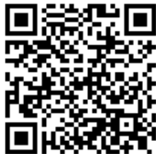
Código QR para validación en sede

Regulación CSV: Decreto 3628/2017 de 20-12-2017